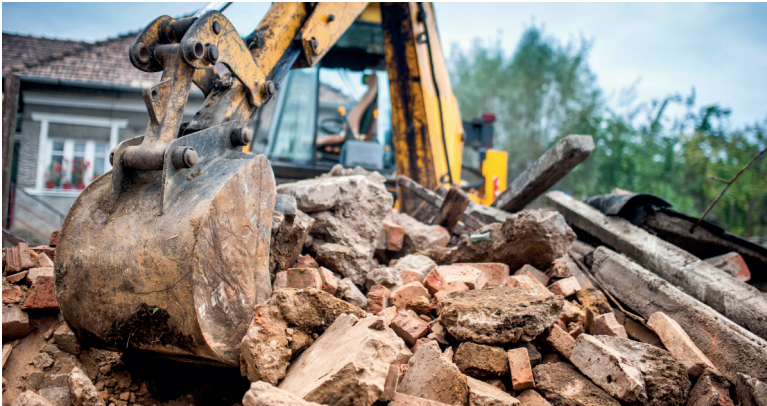
جمع نفايات الهدم والبناء